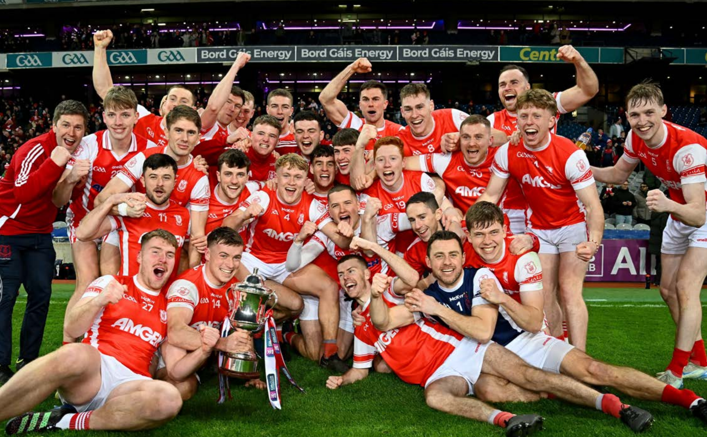
Cuala - Curaidh Peile na hÉireann 2024-2025