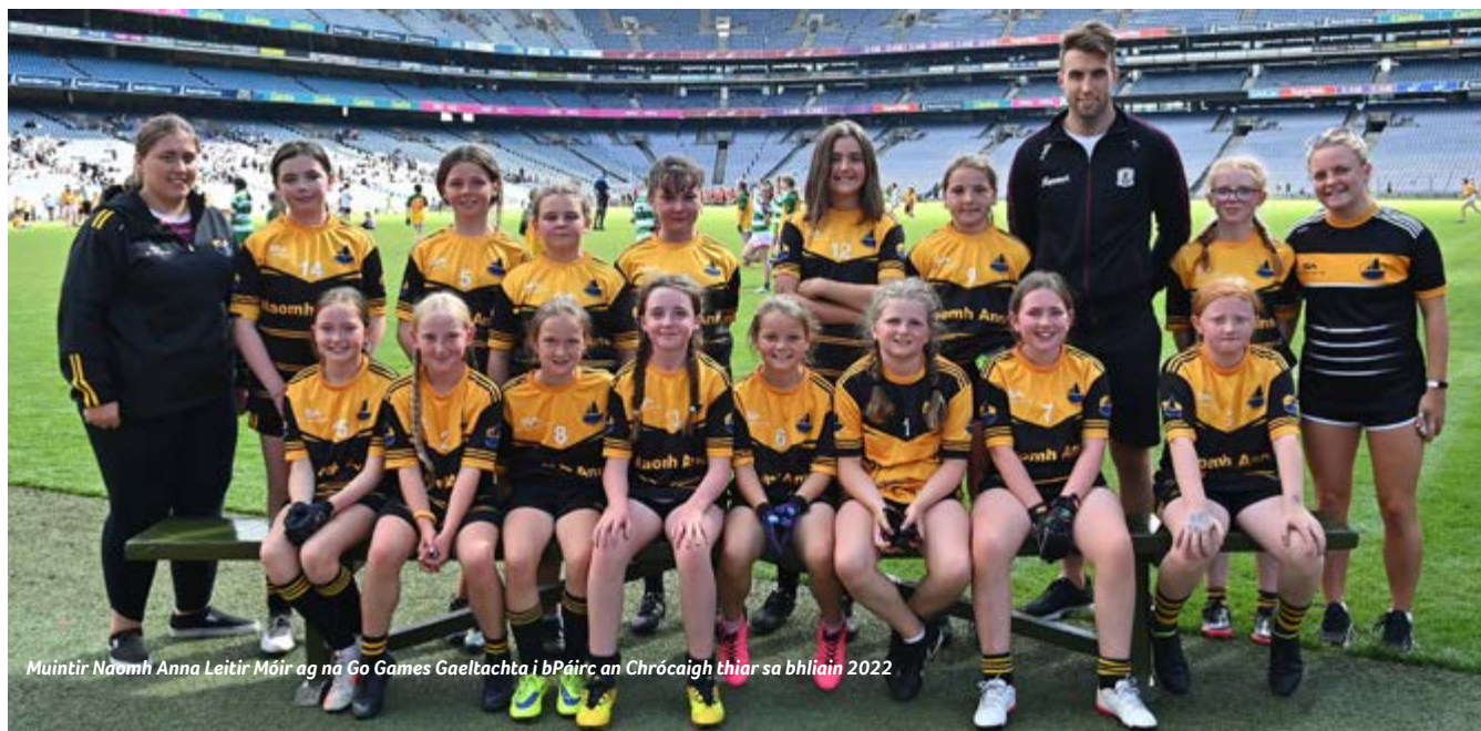
Muintir Naomh Anna Leitir Móir ag na Go Games Gaeltachta i bPáirc an Chrócaigh thiar sa bhliain 2022