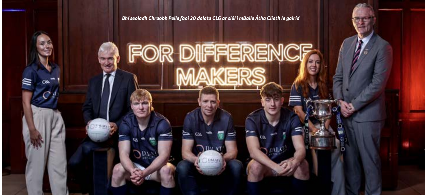
Bhí seoladh Craobh Peile faoi 20 dalata CLG ar siúl i mBaile Átha Cliath le gairid

‘Bheul, tá, is dócha’, a deir Ó Sé, tá sé seachtaine fágtha againn. An bhfuil muid réidh? N’fheadar an mbeidh muid riamh réidh ach táimid ag traenáil linn. Tá, is dócha, comórtaisí coláistí agus comórtaisí scoile ag cur isteach orainn ach tá muid breá sásta leis an ngrúpa atá istigh againn agus tá súil agam anois go mbeidh na coláistí ag críochnú suas. Tá na scoileanna ag críochnú suas sula i bhfad agus ba cheart go mbeadh painéal iomlán againn.