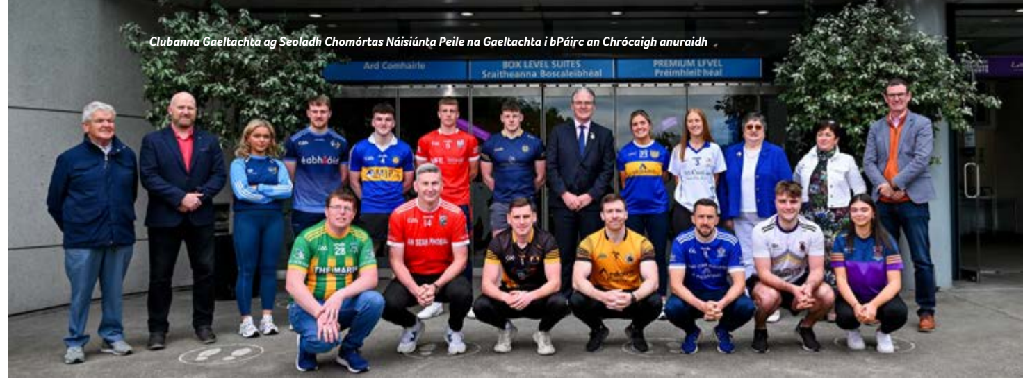
Clubanna Gaeltachta ag Seoladh Chomórtas Náisiúnta Peile na Gaeltachta i bPáirc an Chrócaigh anuraidh